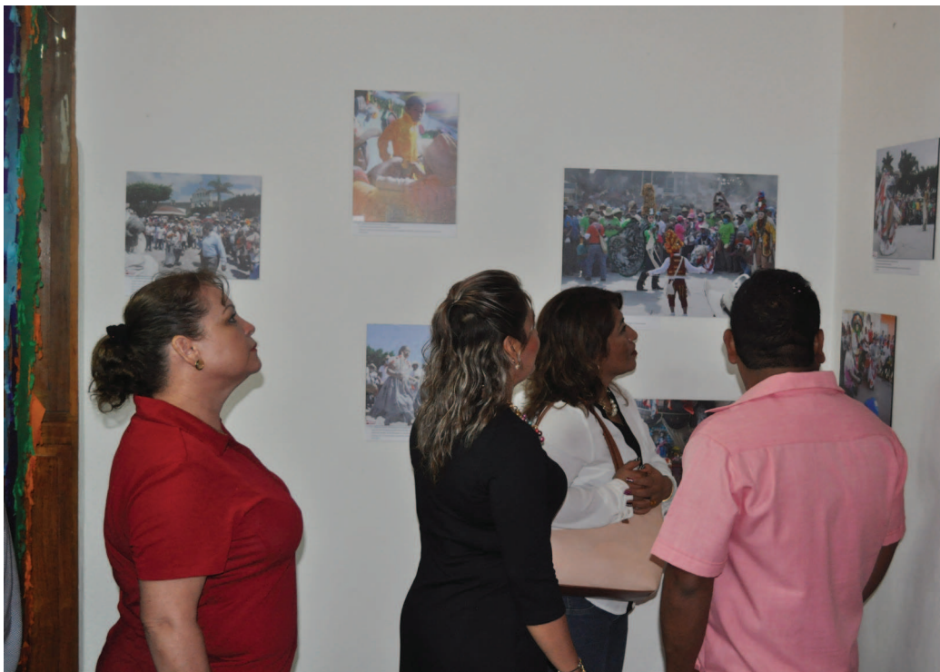
Figuras 4 y 5. Público y cohúina entrantes mirando la exposición temporal. Acervo PCZ. Majkxkubyä y mojsabyä Tzákiram. Pändam, yomoram y Kowí'na ne ya'myajubä te' tzájkpuriram. Acervo PCZ.