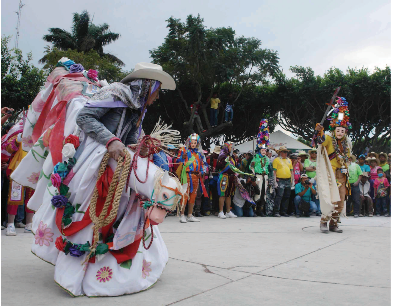
30. Baile de plaza . Danza del Caballo con el Mahoma de Cochi 30. Májá etze. Kawayu etze te' yoya Mahomajin.