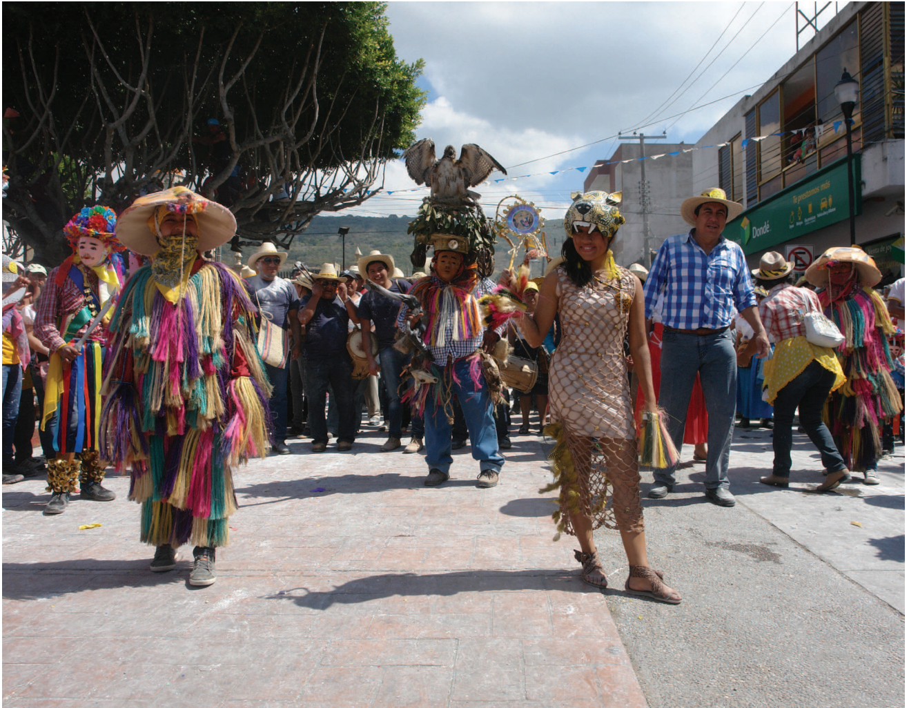
16. Desfile de Cohuina de Tigre junto con su embajadora, tata mono y cohuina. 16. Kak kowi'na'is Jyila ka'nguy, yomo ñarujin, te'serike te' tata tzawijin y ñe'ka te' kowi'najin.