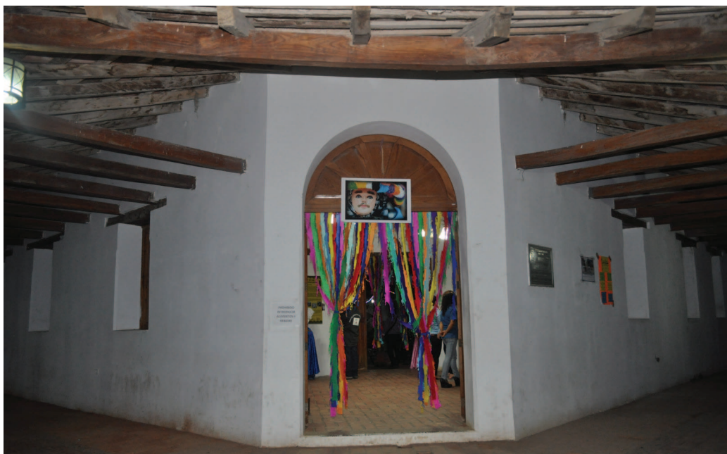
Figura 2. Entrada del Museo Zoque de Ocozocoautla de Espinosa, 29 de julio de 2016. Acervo PCZ. Metzabyä Tzáki. Tájkis yandun kyoketyajpamá ya'ajkbá ore pä'nis chäkiram, Piku kubguy, 29 julio poya'omo 2016 ame'omo. Acervo PCZ.