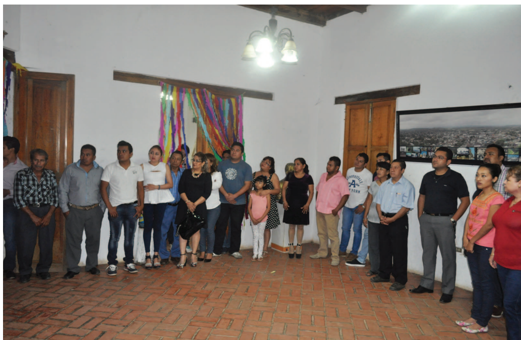
Figura 3. Cohuina y público presentes en la inauguración de la exposición temporal ¡Jule, jule! El Carnaval zoque coiteco, 2014-2016, Museo Zoque, Ocozocoautla de Espinosa.

Tu'kabyä Tzáki. Kowi'na, pändam y yomoram oyajubä tzu'tzu'k te' tzájkpuri a'nguy näyibä: ¡Jule, jule! El Carnaval Zoque Coiteco, 2014-2016, Tájik kyoketyajpamá ya'ajktambä ore pä'nis chäkiram. Piku kubgyumä.