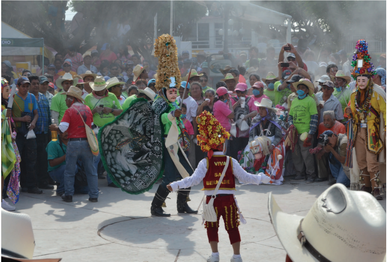
35. Baile de plaza donde se enfrenta el David con el Mahoma Goliath. El bien contra el mal. 35. Mäja etze. Nākijpamā David te' Mahoma Goliath. Te' wābā pāt te' yachokojinbā.