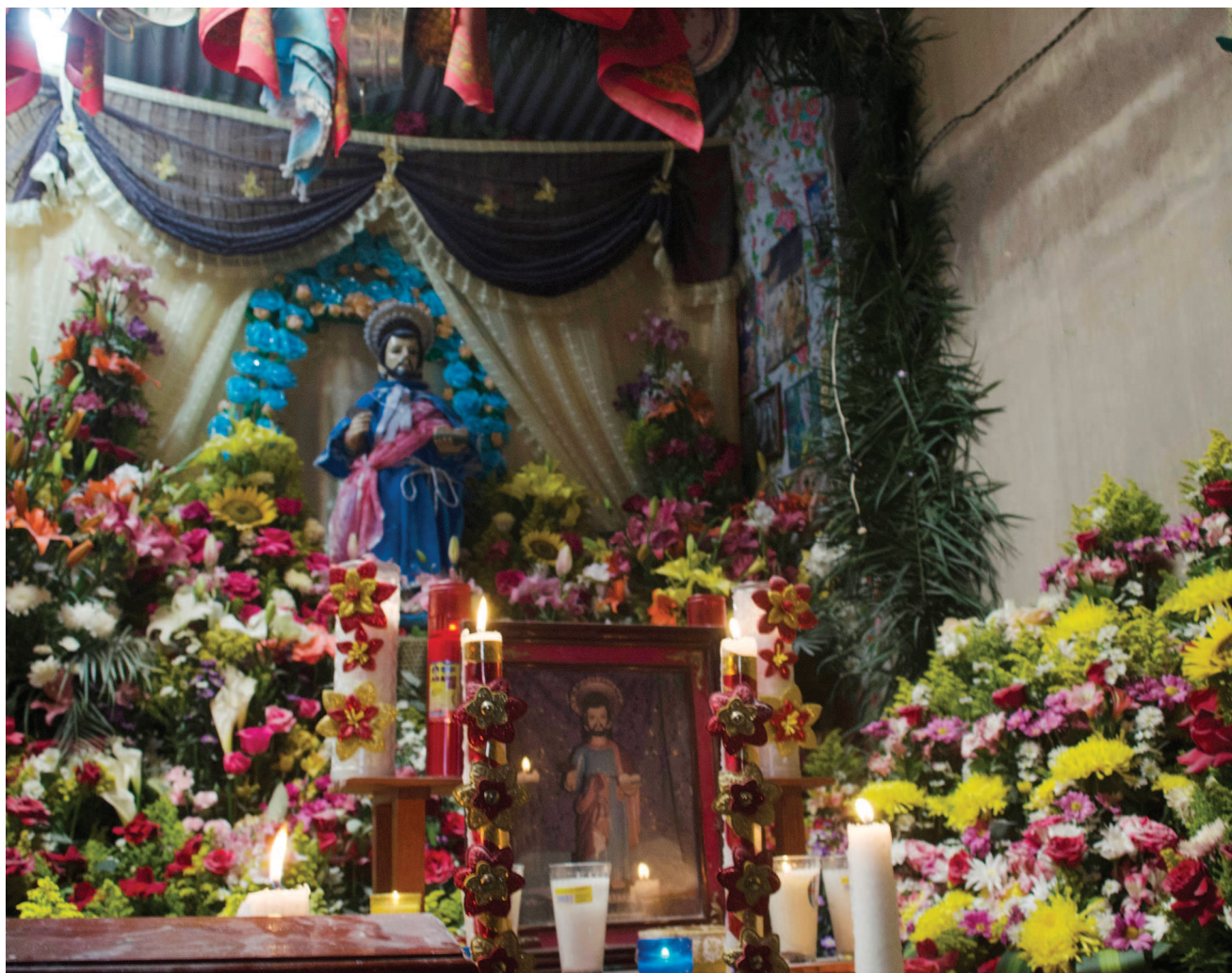
34. Altar del Cohuina de San Bernabé con todos sus detalles. Velas, flores, somés y las imágenes. 34. Dá gomi Bernabe kyowí'na'is myexa. Kejpamá no'aram, jáyaram, ajchákiram y te' dá gomiram.